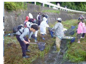
▲水生生物による水質調査