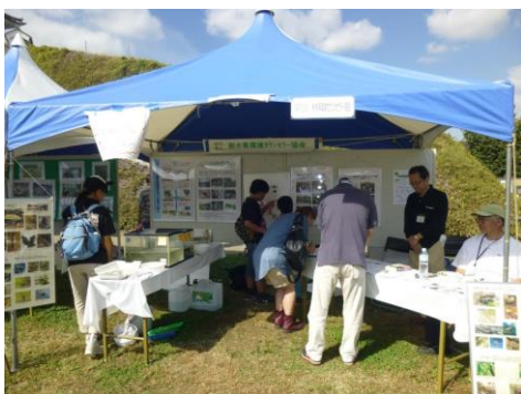
宇都宮市主催「もったいないフェア」出展