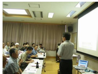
▲シルバー大学で環境問題の講演