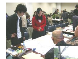
◀ 環境指導者養成講座での実習